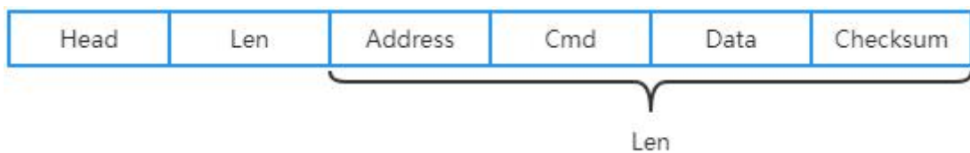
图 1 上位机发送数据包格式