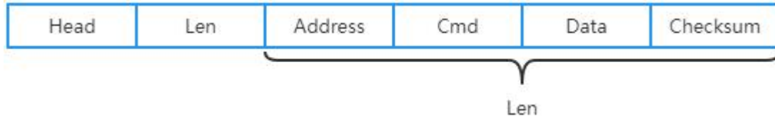
图 2 读写器返回数据包格式