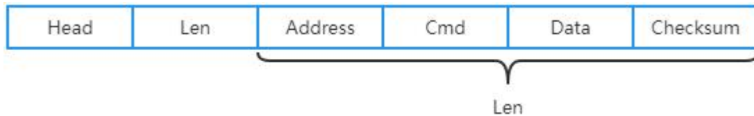
图 2 读写器返回数据包格式